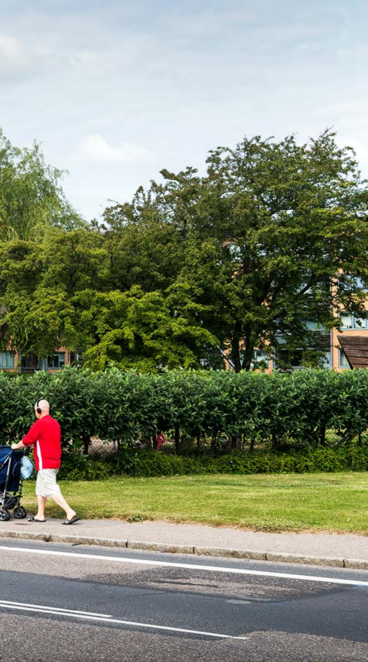
Ringparken, Slagelse.